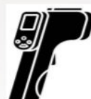
Toma de Temperatura